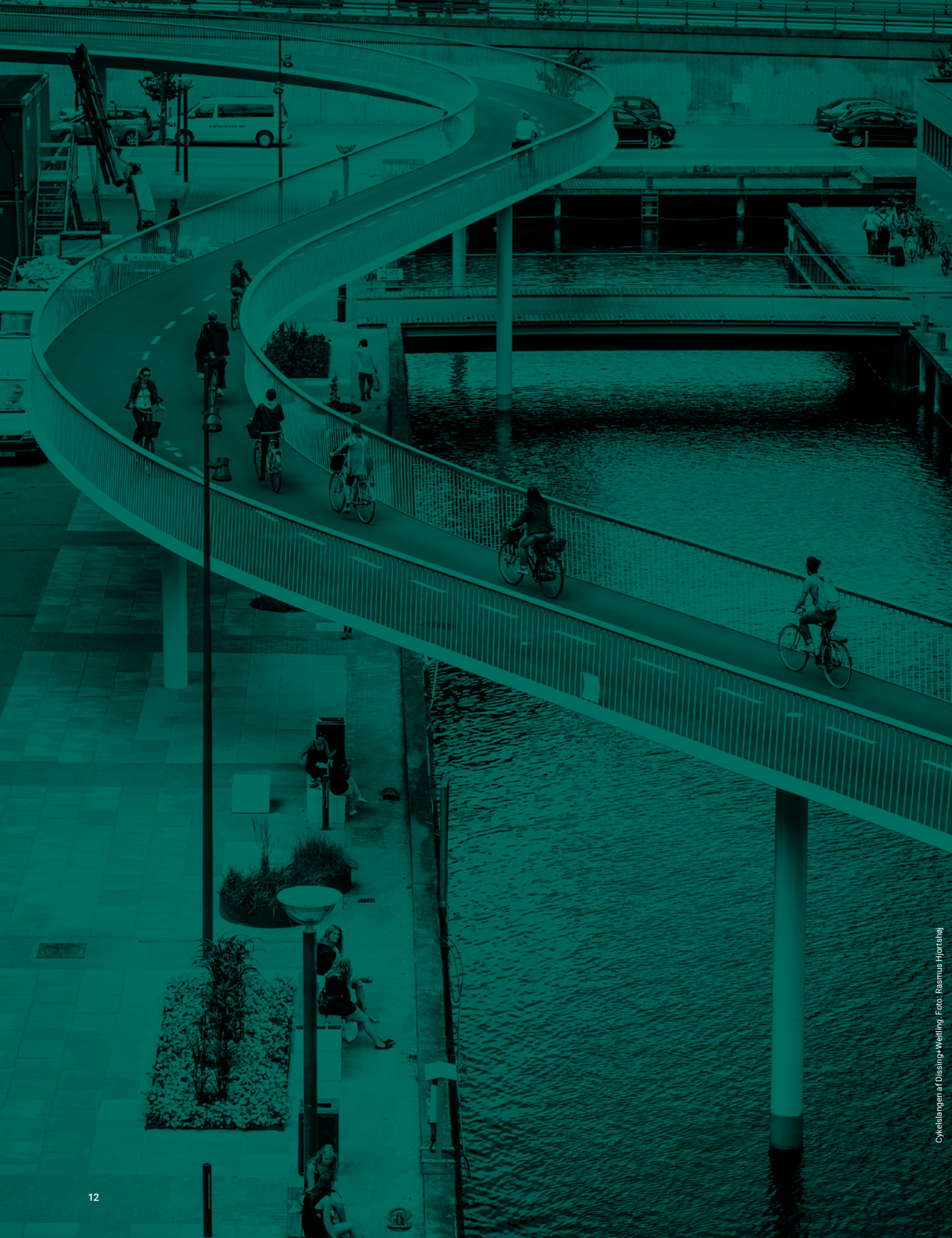
Cykelstangen af Dissing+Weitling.